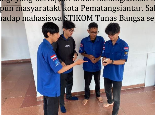
Gambar 2. Scene diskusi Peduli Lingkungan

Berdasarkan gambar diatas dapat diambil menjadi salah satu Video gagasan konstruktif, yang dimana Pematangsiantar merupakan salah satu kota di Sumatra Utara di tingkat 5 pada tahun 2021. Dengan ini team PKM STIKOM Tunas Bangsa Pematangsiantar mengambil tema video berupa peduli lindungi yang bertujuan untuk meningkatkan kesadaran diri dan motivasi terhadap mahasiswa maupun masyarakat kota Pematangsiantar. Salah satu scene yang diambil adalah berupa diskusi terhadap mahasiswa STIKOM Tunas Bangsa seperti berikut :