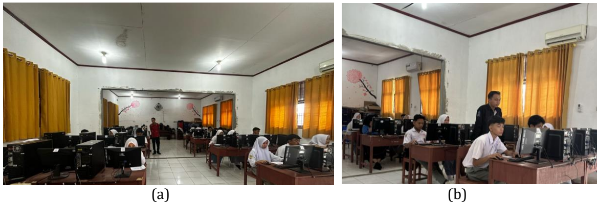
Gambar 1. Arahan dan Pendampingan Pengujian Eksternal (a) dan (b)

Berdasarkan hasil yang diperoleh, bahwa pendampingan yang dilakukan pengujian eksternal dalam pelaksanaan UKK mampu memperkuat kompetensi siswa secara keseluruhan, aspek pengetahuan, keterampilan dan sikap kerja yang profesional. Temuan ini sejalan dengan pendidikan yang berbasis praktik dan keterlibatan pengujian eksternal sebagai mitra strategis dalam menyiapkan lulusan yang siap kerja. Pendampingan yang dilakukan selama UKK juga memberikan pengalaman nyata bagi siswa dalam menghadapi standar kerja yang profesional dan kompeten. Hal ini memperkuat peran pengujian eksternal tidak hanya sebagai tim evaluator, tetapi juga sebagai pendamping pembelajaran. Sehingga, pendampingan pengujian eksternal dalam pelaksanaan UKK dapat dijadikan sebagai salah satu strategi yang efektif dalam meningkatkan kualitas pelaksanaan uji kompetensi dan daya saing yang baik.