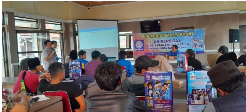
Gambar 1. kegiatan Pelatihan Menggunakan Website