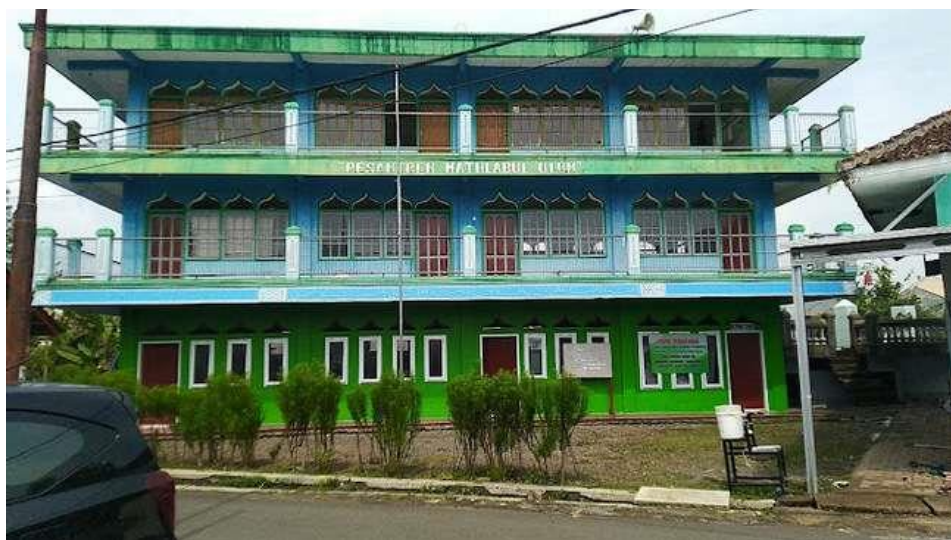
Gambar 1. Pesantren Mathlabul Ulum

Pendidikan anak usia dini sangat penting dilaksanakan dengan serius agar bisa menghasilkan generasi penerus bangsa yang unggul. Mitra pada pelaksanaan Pengabdian Pada Masyarakat (PPM) kali ini adalah TAAM Mathlabul Ulum yang merupakan sebuah lembaga yang mejadi pihak dalam mendidik dan berperan dalam melindungi anak sebagai korban kejahatan maupun anak yang menjadi pelaku tindak kejahatan, TAAM dalam hal ini menjadi pendamping anak yang ingin mendapatkan pendidikan dan perlindungan. TAAM Mathlabul Ulum berlokasi di Jl. KH. Busthomi, Awipari, Kec. Cibeureum, Kab. Tasikmalaya, Jawa Barat. Lokasi TAAM Mathlabul Ulum menyatu dengan pondok pesantren mathlabul ulum.